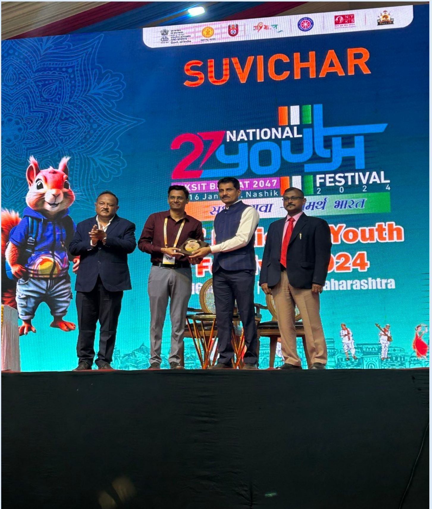
NSS Program Officer was honored and received this award for his dedication and management by Ministry of Youth and Sports in 27th National Youth Festival 2024 which was held in Nashik, Maharashtra